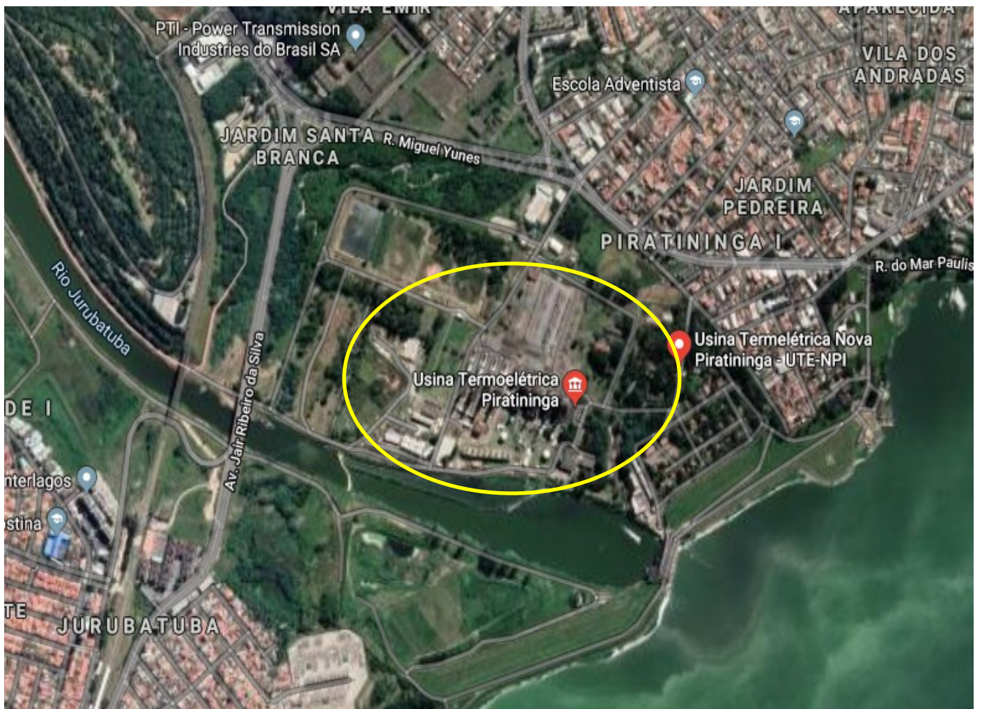
Imagem 1 - Vista Geral da localização do Empreendimento